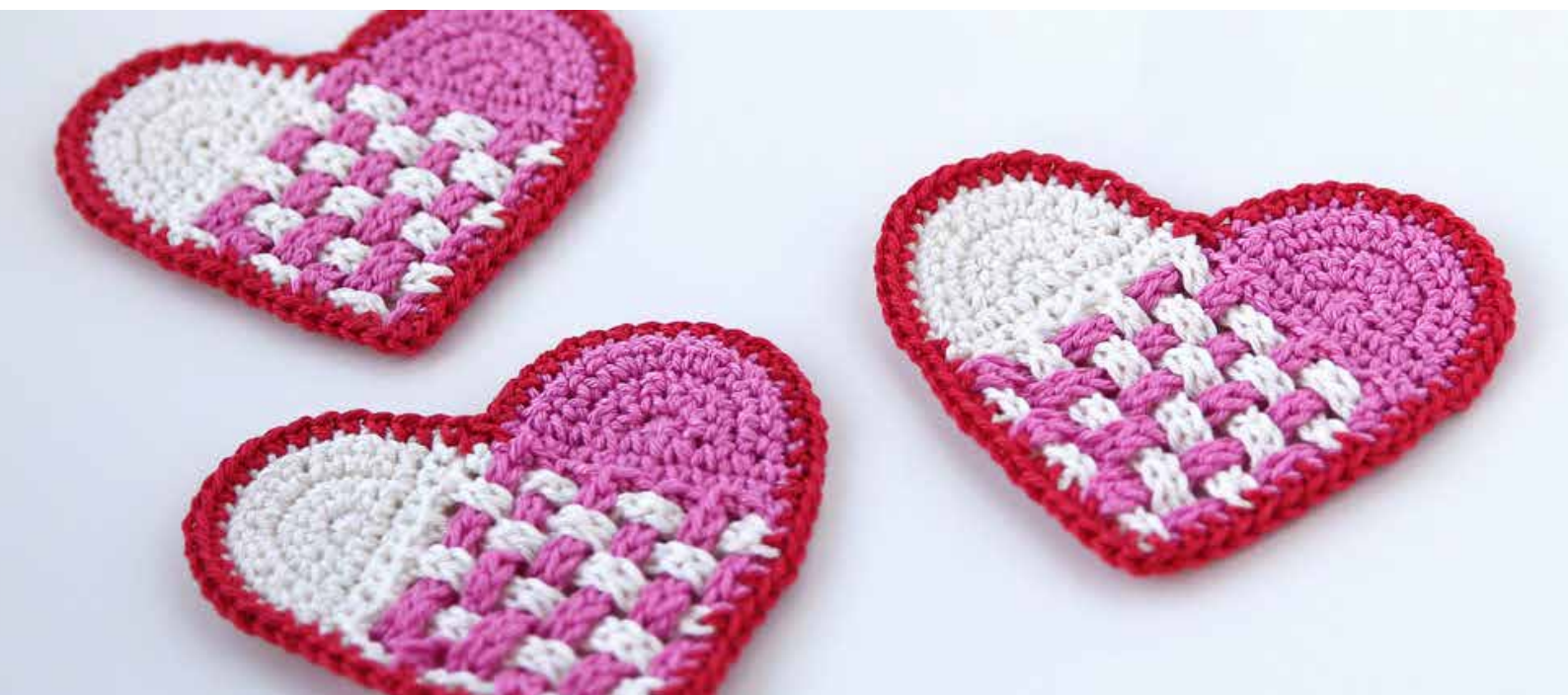
Scandinavisch hart (bonus patroon)